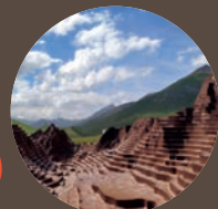
COLLE DELLA MADDALENA 1996m slm

Opera di land art TABLE-RELIEF di David Renaud