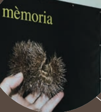
MADONNA DEL COLLETO 1305m slm