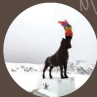
Opera di land art BOUQUETIN GÉANT di Cédric Pignataro Scultura monumentale in resina alta oltre cinque metri rappresentante un camoscio

Opera di land art TABLE-RELIEF di David Renaud Opera in rilievo che rappresenta il paesaggio circostante, propone l'esperienza di essere contemporaneamente di fronte, sopra e davanti al paesaggio